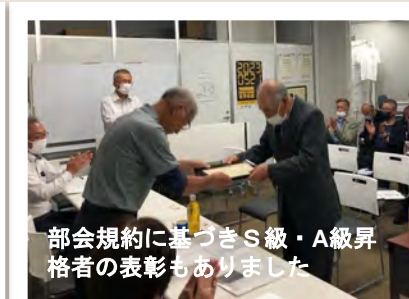
部会規約に基づきS級・A級昇格者の表彰もありました