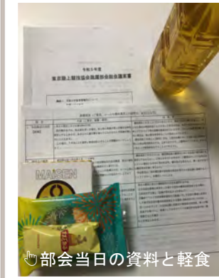
部会当日の資料と軽食