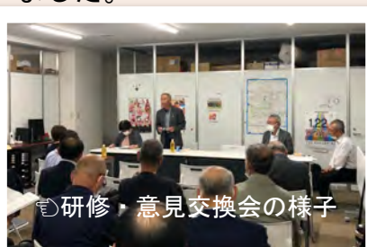
研修・意見交換会の様子