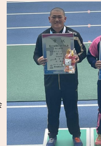
第72回国民スポーツ大会陸上競技大会 少年男子Aハンマー投げ優勝 北選手(保善高)