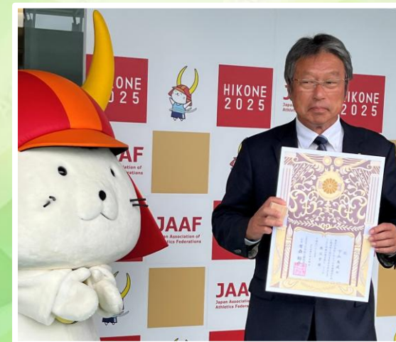
第79回国民スポーツ大会の 陸上競技場にて授賞式開催